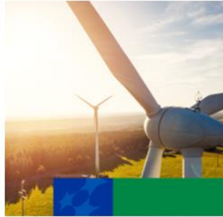
Infrastruktura, Klimat, Środowisko