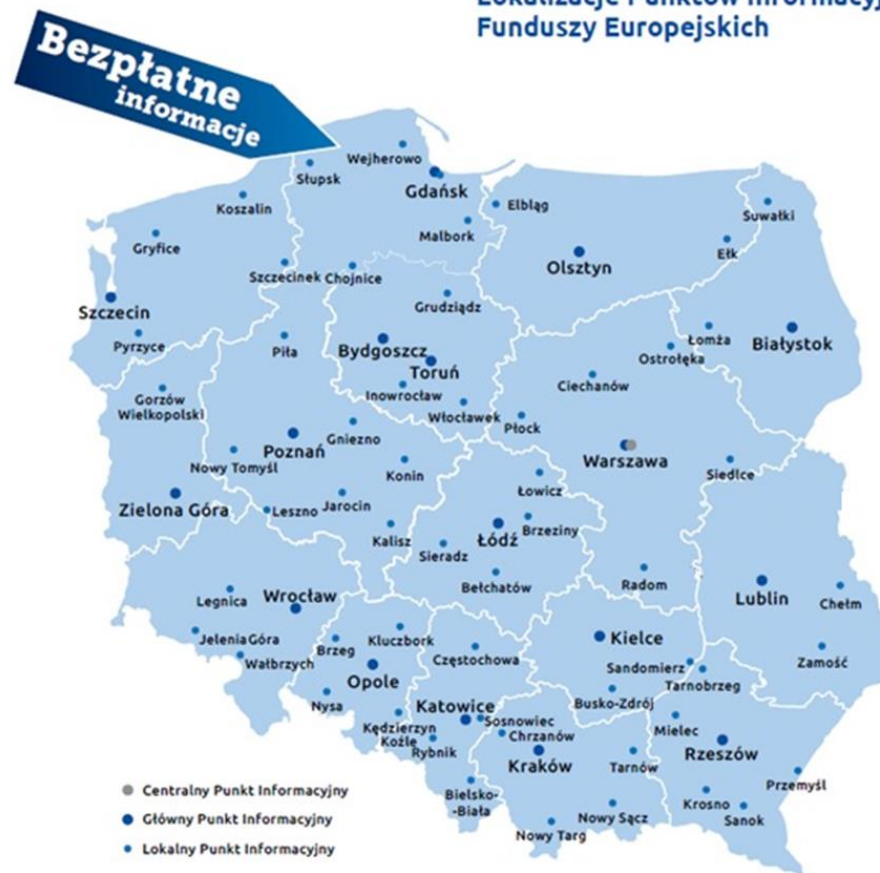
Lokalizacje Punktów Informacyjnych Funduszy Europejskich

Lokalny Punkt Informacyjny Funduszy Europejskich (LPI)