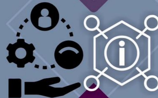
Zasoby informacji zawodowych on-line