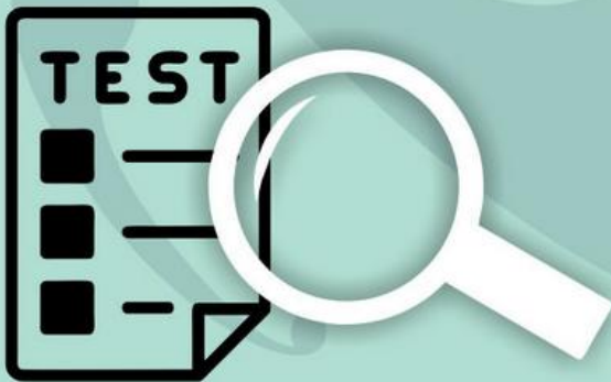
Bezpłatne badania predyspozycji zawodowych