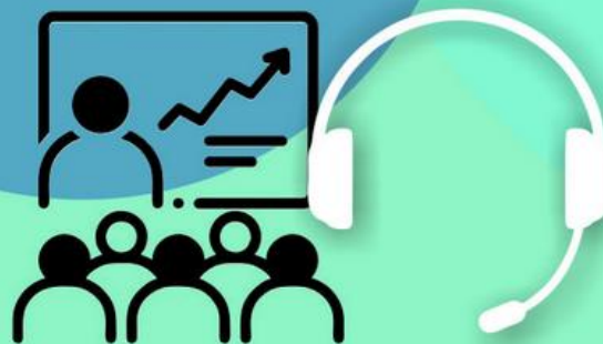
Oferta Centrum - webinary